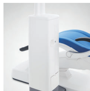
Intego и Intego Pro без плевательницы