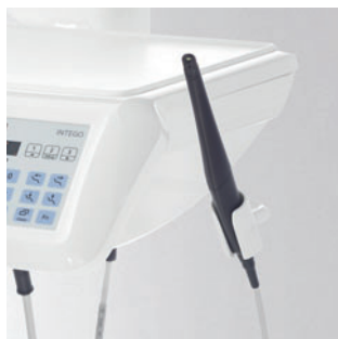
Дополнительный держатель для камеры (модуль врача TS)