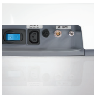
Разъемы для подключения внешних устройств