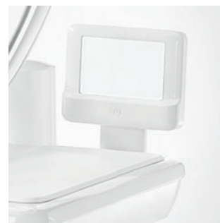
Негатоскоп для панорамных снимков