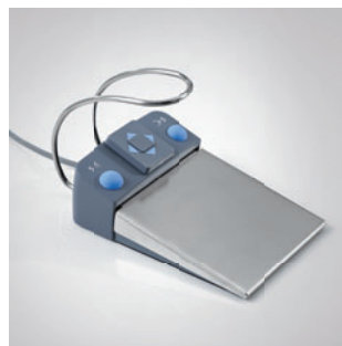
Электрическая педаль ножного управления C+