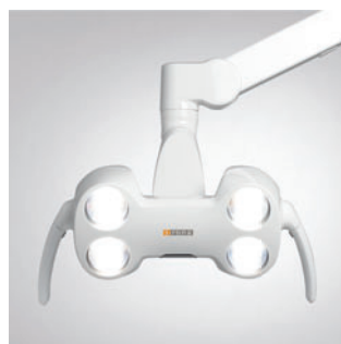
Светильник LEDview Plus