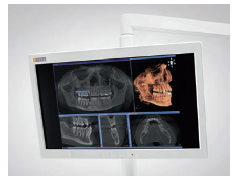
Монитор Sivision 22"

При помощи этого монитора вы сможете комментировать изображения полости рта и рентгеновские снимки пациентам, работать с ПО, планировать лечение, просматривать видео и презентации непосредственно на стоматологической установке.