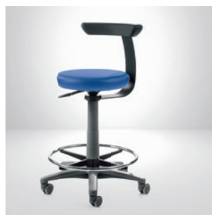
Рабочий стул Paul с кольцевым упором для ног