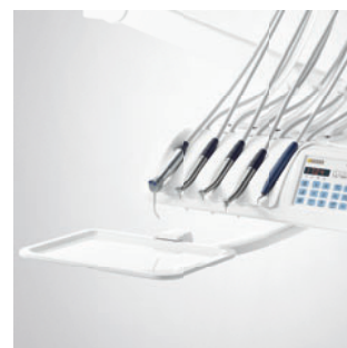
Дополнительный большой поддон (модуль врача CS)