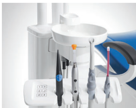
Модуль ассистента «Компакт»

Оба варианта модуля ассистента занимают очень мало места и гарантируют максимум свободы движения. С моделью «Комфорт» вы можете комфортно работать даже без ассистента.