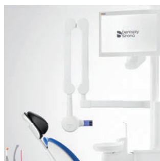
Heliodent Plus с креплением на установке