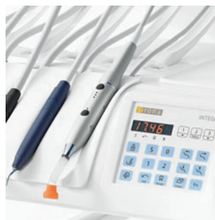
Полимеризационная лампа Satelec Mini LED