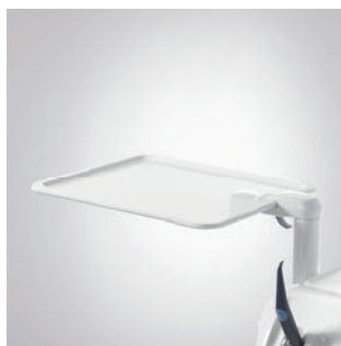
Дополнительный поворотный поддон (модуль врача TS)