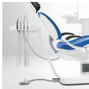
Модуль ассистента «Комфорт»