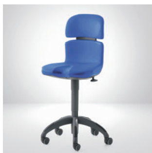
Рабочий стул Hugo