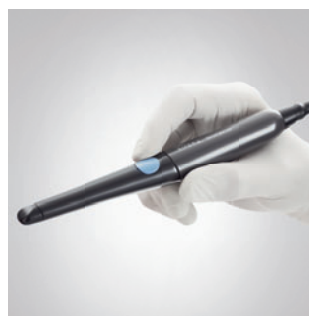
Камера SiroCam AF