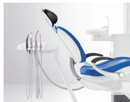
Модуль ассистента «Комфорт»