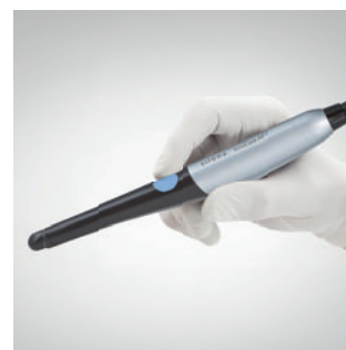
Камера SiroCam AF+